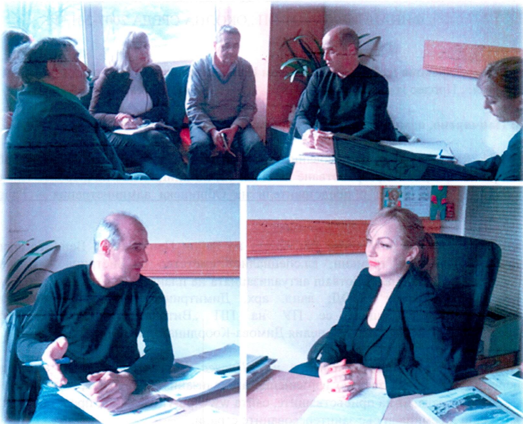
Момент от Работна среща с представители на Общинска администрация – Район Панчарево

Работната среща завърши с уточнението, че предстоят срещи на представителите на Екипа за ПУ в кметствата и с местните жители от района.