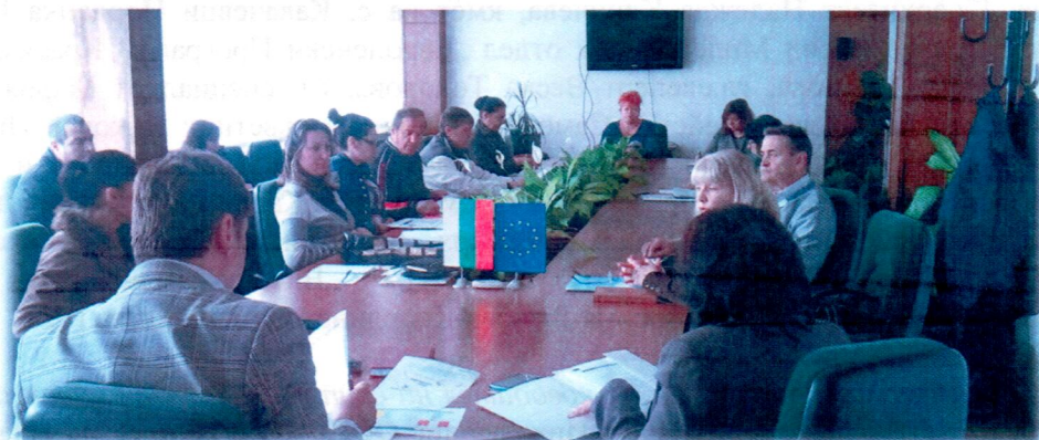
Момент от Работна среща с представители на Общинска администрация гр. Самоков