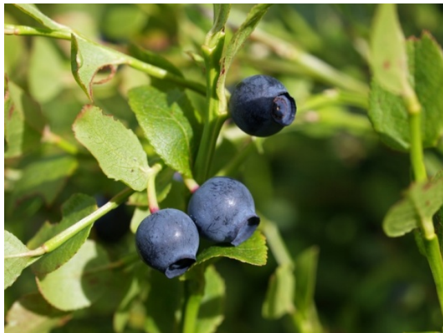
Черна боровинка ( Vaccinium myrtillus )

□ Определени са видовете лечебни растения с потенциални ресурсни възможности на територията на ПП Витоша. Това са риган, жълт кантарион, малина, боровинка, леска, горска ягода, глог, мащерка, къпина, иглика.