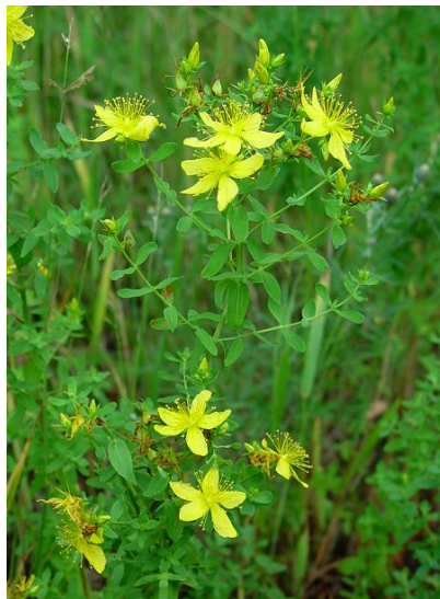
Жълт кантарион ( Hypericum perforatum )